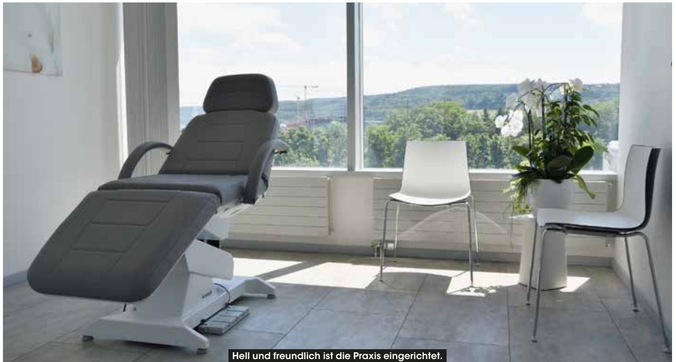
Heil und freundlich ist die Praxis eingerichtet.